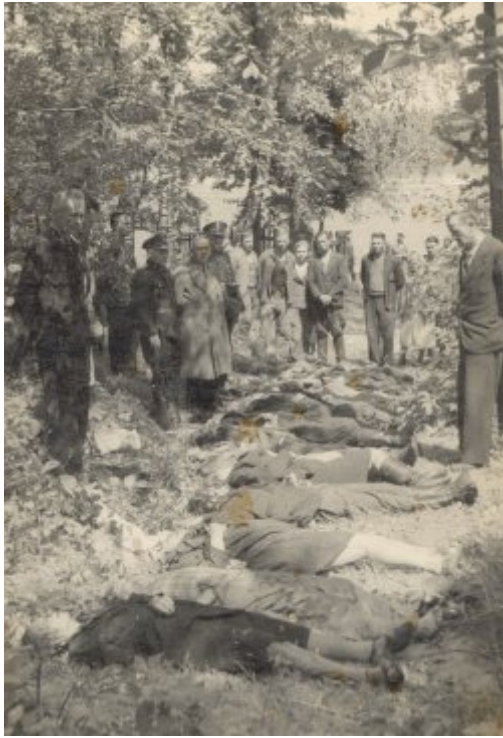
Ofiary napadu na pociąg pod Zatyłem (ok. Lubyczy Królewskiej) dokonanego 16 czerwca 1944 r. przez UPA.