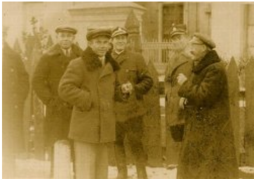
Najprawdopodobniej mieszkańcy Porycka, lata 30. XX w.