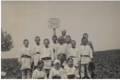
1934, Toporowce, powiat Horodenka, woj. Stanisławów. Dzieci na kursie Przynależności Rolniczego, na tablicy napis w języku polskim i ukraińskim: \