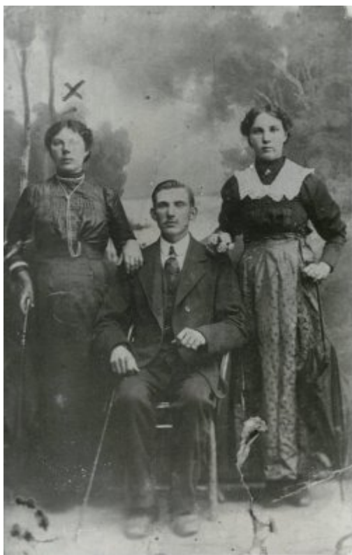
Rodzina zamordowana w dniu 11.07.1943 r. w Witoldowie. Mat. z akt śledztwa lubelskiej OKŚZpNP w sprawie zbrodni dokonanych w 1943 r. na obywatelach polskich przez nacjonalistów ukraińskich w miejscowości Witoldów na Wołyniu.