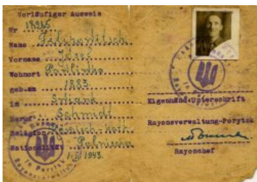
Ausweis Józefa Filipowicza zamieszkałego w Porycku (Pawliwce), wystawiony 1 II 1943 r. W marcu 1944 r. dokument potwierdzony w Ropczycach w powiecie dębickim.