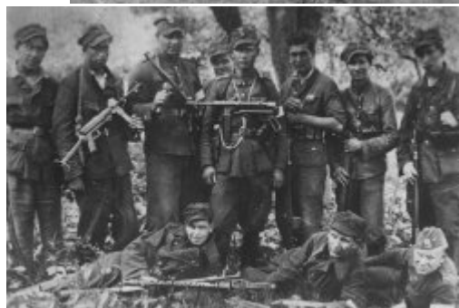
Drużyna kpr. „Muszki” z 27 Wołyńskiej Dywizji Piechoty Armii Krajowej 1944 r.