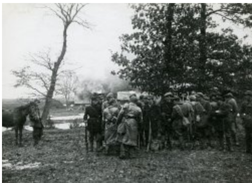
Sahryń, 10 marca 1944 r - akcja odwetowa oddz. Tomaszowskiego Obwodu AK wobec ukraińskich mieszkańców wsi. Muzeum Regionalne w Tomaszowie Lubelskim (nr 2)