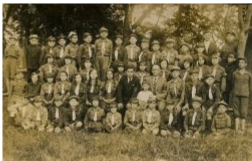
Harcerki i harcerze z Porycka, okres międzywojenny.