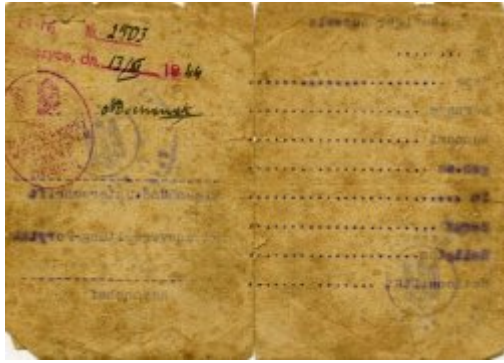
(nr 4) Ausweis Józefa Filipowicza zamieszkałego w Porycku (Pawliwce), wystawiony 1 II 1943 r. W marcu 1944 r. dokument potwierdzony w Ropczycach w powiecie dębickim.