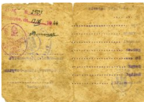
Ausweis Józefa Filipowicza zamieszkałego w Porycku