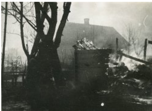
Sahryń, 10 marca 1944 r. Akcja odwetowa oddz. Tomaszowskiego Obwodu AK wobec ukraińskich mieszkańców wsi. (nr 1)