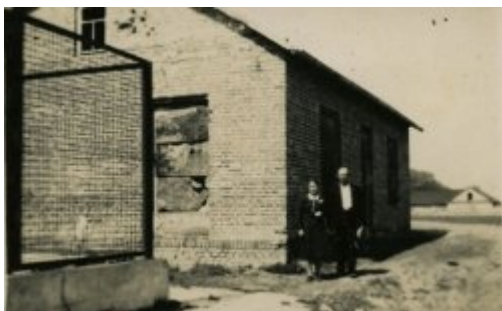
Poryck fot. wykonana 10 czerwca 1943 r.