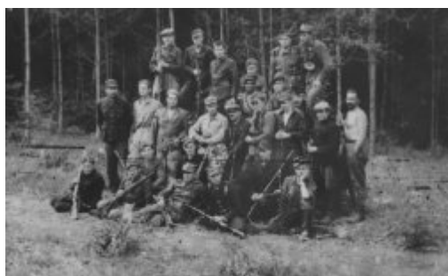
Oddz. samoobrony na Wołyniu 1943 r.