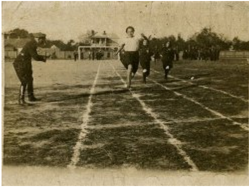
Zawody sportowe, Poryck, okres międzywojenny.