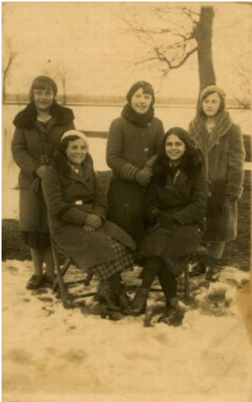
Mieszkancki Porycka, okres międzywojenny. Zbiory Piotra Filipowicza.