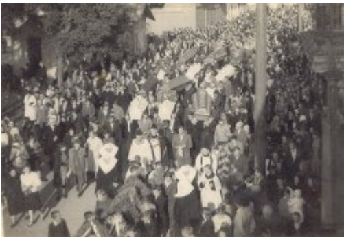
Pogrzeb polskich ofiar napadu na pociąg pod Zatyłem (ok. Lubyczy Królewskiej) dokonanego 16 czerwca 1944 r. przez UPA. Muzeum Regionalne w Tomaszowie Lubelskim.