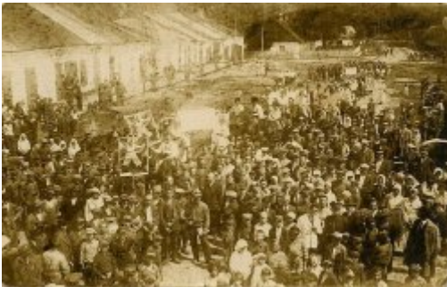
Mieszkańcy miasteczka Poryck (Pawliwka), pow. Włodzimierz Wołyński, lata 30. XX w. zbiory Piotra Filipowicza