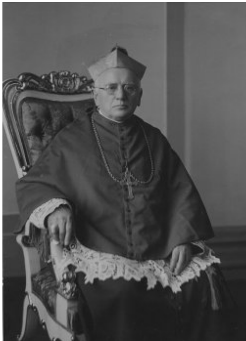
Bolesław Twardowski - arcybiskup metropolita lwowski obrządku łacińskiego. Fotografia portretowa.