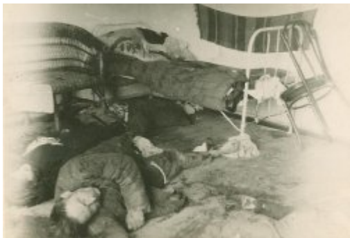
zdj. nr 2 Zdjęcie ze śledztwa IPN Lublin dot. Wołynia