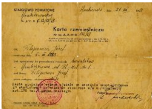
Karta rzemieślnicza - wystawiona na nazwisko Józefa Filipowicza przez Starostwo Powiatowe w Hrubieszowie. Po ucieczce z Porycka Józef Filipowicz osiadł w Hrubieszowie.