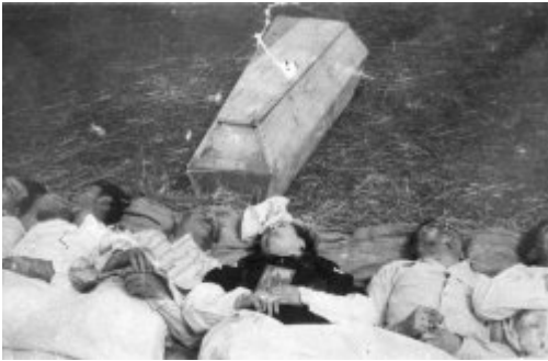
Chołopce, powiat Horochów, Wołyń. Czesi pomordowani przez Ukraińców we wsi Chołopce.