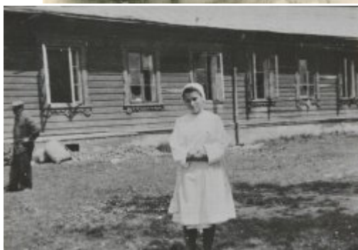
fot. ze zbiorów Muzeum Chełma (nr 1) Chełm, Ochronka PCK, pełniąca funkcje szpitala dla ludności polskiej podczas okupacji. W 1943 r. trafili do niej uciekinierzy z Wołynia.