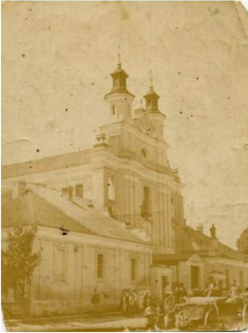
Kościół parafialny w Porycku, okres międzywojenny. 11 lipca 1943 r. oddział UPA wymordował zebranych na nabożeństwie mieszkańców Porycka, ocalało jedynie kilkanaście osób. Zbiory Piotra Filipowicza.