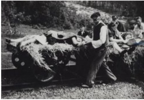
Ofiary napadu na pociąg pod Zatyłem (ok. Lubyczy Królewskiej) dokonanego 16 czerwca 1944 r. przez UPA.