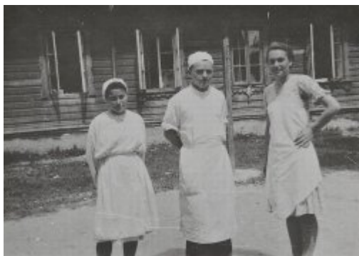
(nr 2) Chełm, Ochronka PCK, pełniąca funkcje szpitala dla ludności polskiej podczas okupacji. W 1943 r. trafili do niej uciekinierzy z Wołynia.