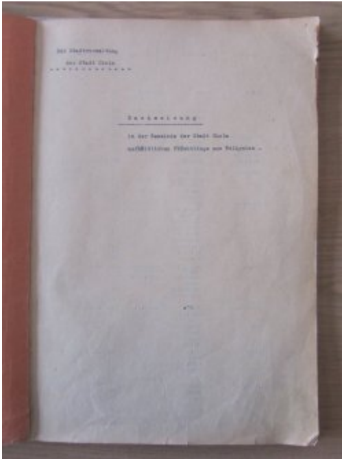
Akta miasta Chełma (nr 1) „Ewidencja ludności z Wołynia”, brak daty, tytuł oryginalny: „Nachweisung in der Gemeinde der Stadt Cholm aufhältlichen Flüchtlinge aus Wolhynien”, na liście jest 1578 osób