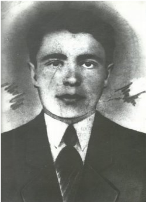
Mężczyzna zamordowany w dniu 11.07.1943 r. w Witoldowie. Mat. z akt śledztwa lubelskiej OKŚZpNP w sprawie zbrodni dokonanych w 1943 r. na obywatelach polskich przez nacjonalistów ukraińskich w miejscowości Witoldów na Wołyniu.